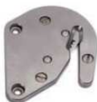
Cuchilla sop. Inox